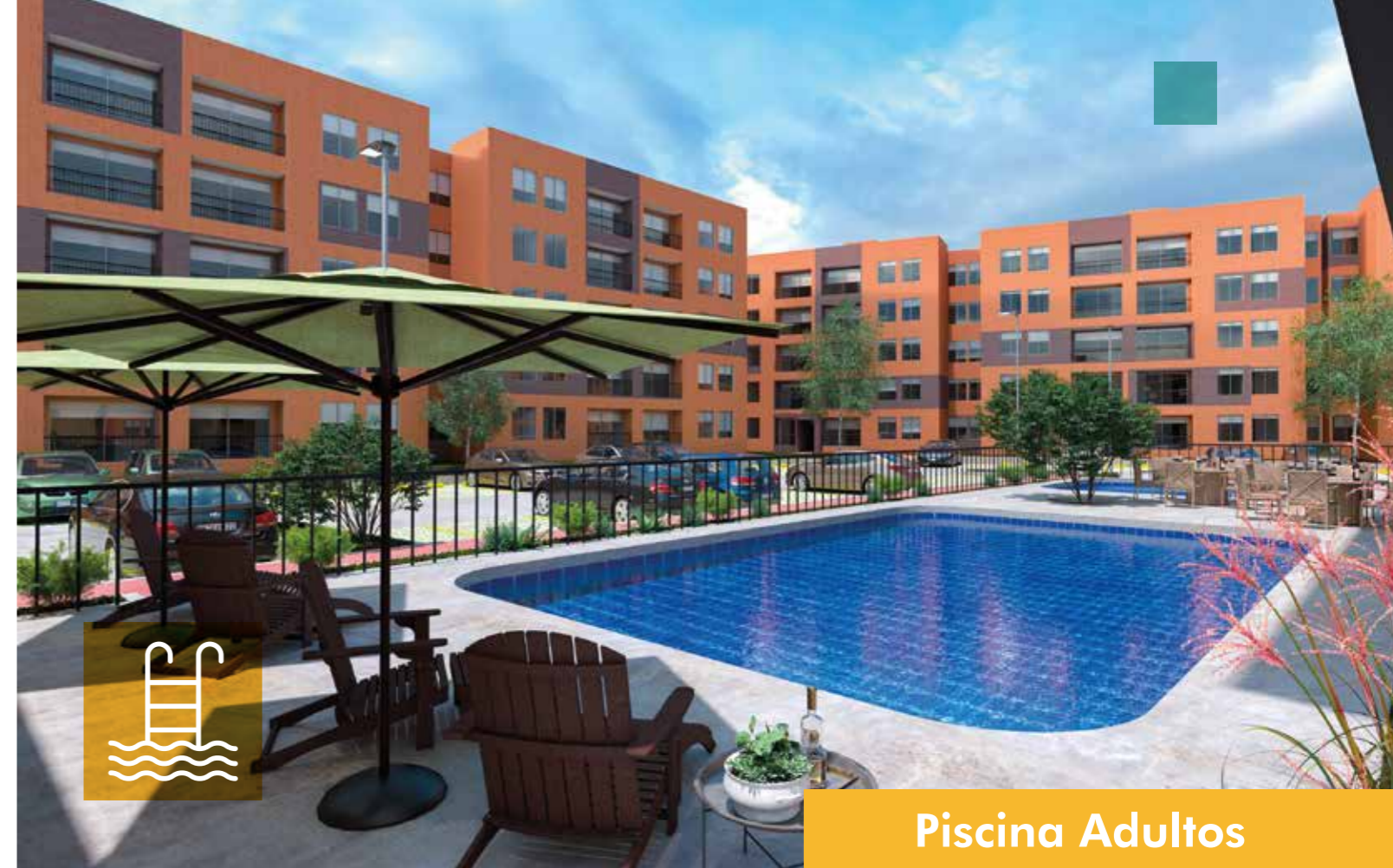
Piscina Adultos Piscina Niños