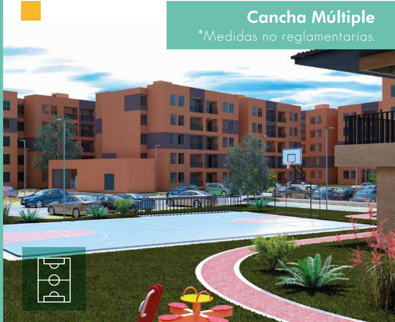
Cancha Múltiple *Medidas no reglamentarias.